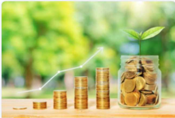
The InvestEU Fund