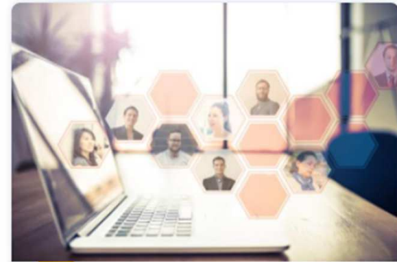
The InvestEU Portal