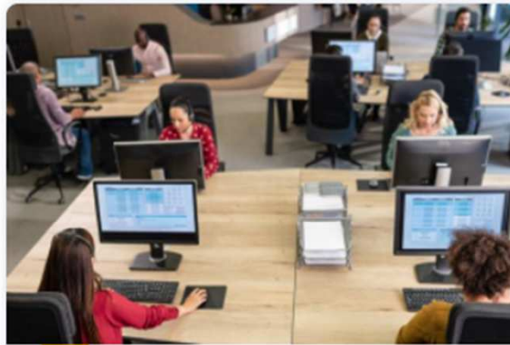
The InvestEU Advisory Hub