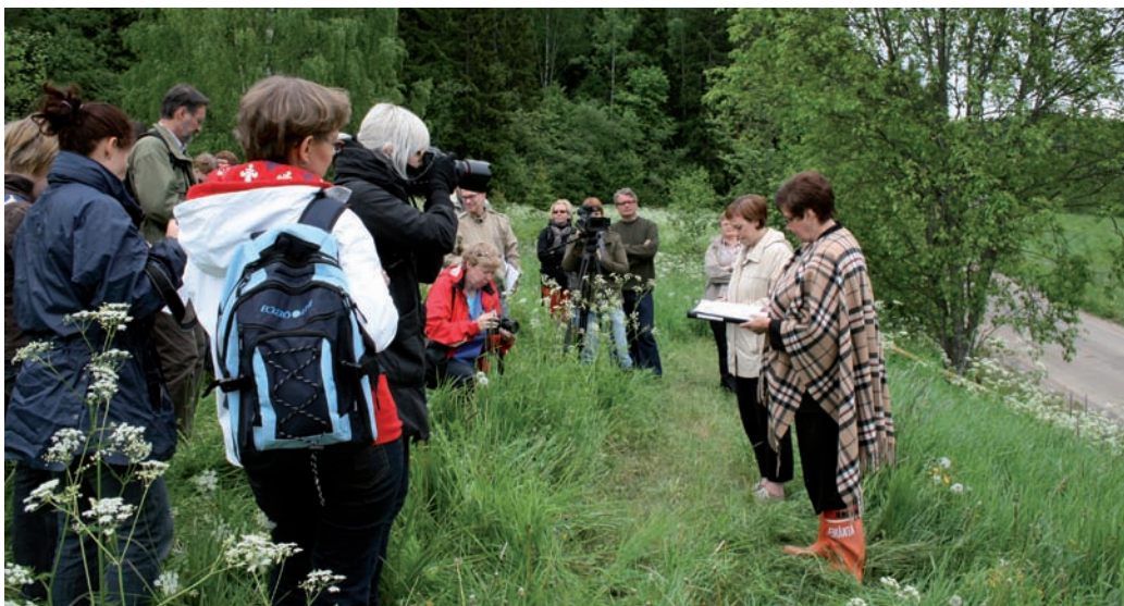
Perinnebiotooppeihin keskittyneellä toimittajaretkellä toimittajat saivat tutustua laidunnukseen, maisemanhoitoon ja luomuviljelyyn. Ympäristön tilaa koskeviin kysymyksiin vastasivat myös ministerit Sirkka-Liisa Anttila ja Paula Lehtomäki.

Maaseutuverkosto järjesti 8.6.2010 yhdessä maa- ja metsätalousministeriön viestinnän, ympäristöministeriön ja Uudenmaan ELY-keskuksen kanssa ympäristöaiheisen toimittajaretken. Retkellä tutustuttiin kohteisiin, jotka havainnollistivat maisemanhoidon merkitystä luonnon monimuotoisuuden kannalta, koska luonnon monimuotoisuuden häviäminen on kaikkia kansalaisia koskettava ongelma. Retki liittyi sekä YK:n kansainväliseen biodiversiteettivuoteen että Manner-Suomen maaseudun kehittämisohjelman ympäristöteemavuoteen. Uudellemaalle ja itäiselle Uudellemaalle suuntautuneen retken ensimmäisessä kohteessa olivat mukana ministerit Sirkka-Liisa Anttila ja Paula Lehtomäki. Toimittajaretkelle osallistui runsaasti ympäristöasioista kiinnostuneita toimittajia. Havainnollistava retkipäivä ylitti onnistumisessaan järjestäjienkin odotukset.