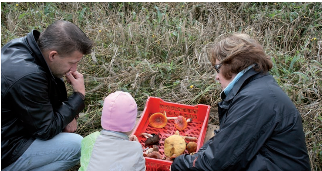
Yhteistyössä 4H-liiton kanssa suunniteltu Ympäristörata koostuu tehtävistä, joiden avulla lapset voivat tutustua maaseudun ympäristön hoitoon, luonnon monimuotoisuuteen ja vesiensuojeluun.

Ympäristöteemavuoteen liittyvää asiaa ja hyviä käytänteitä löytyy Maaseutu.fi-sivuston ympäristö2010-osiosta.