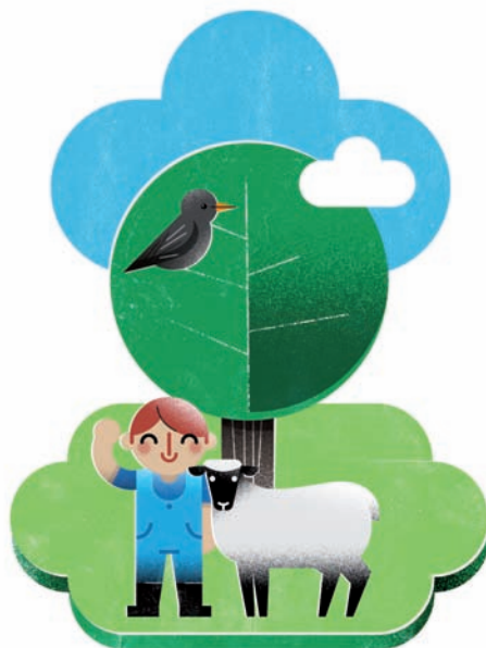
Ympäristöteemavuoden tarpeisiin suunniteltiin muun muassa 5-osainen postikorttisarja.

Vuonna 2010 jatkettiin ohjelman viestintää tukevien valokuvien hankintaa kahden valokuvaajatahon kanssa.