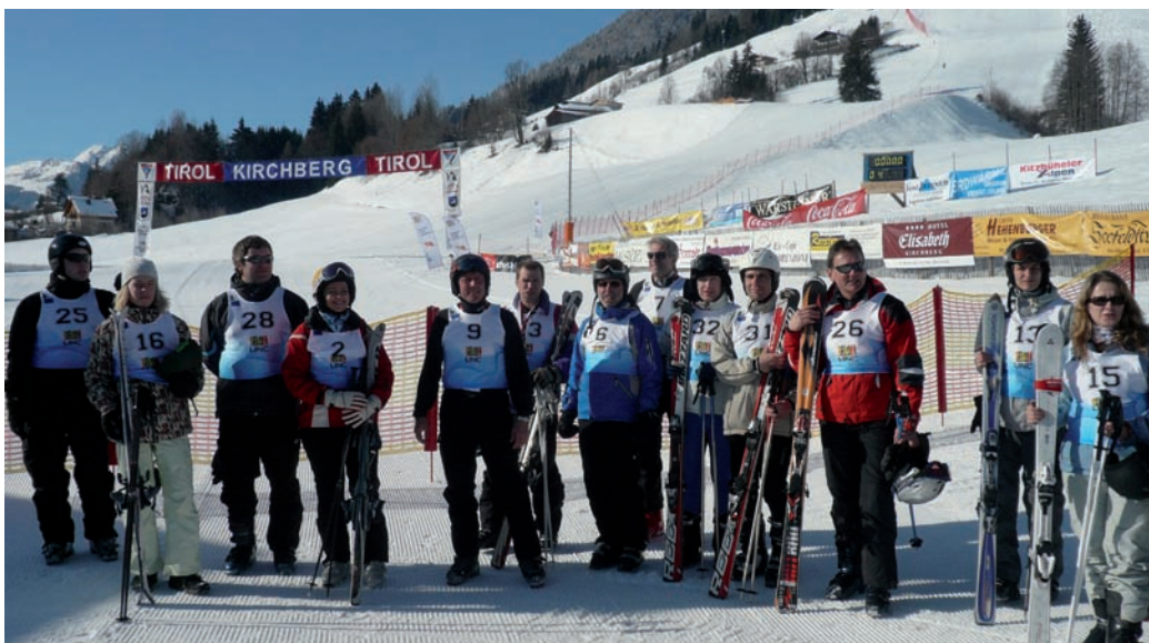
LINC kokosi yhteen yli 200 toimintaryhmien edustajaa. Hurjapäisimmät ottivat osaa suurpujotteluun.

Itävallassa järjestettiin maaliskuussa LINC-seminaari. Maaseutuverkostoyksikkö ja Suomen toimintaryhmien edustajia osallistui tapahtumaan. LINC on uusi yhteistyöseminaarimuoto, joka yhdistää perinteisen seminaari-työskentelyn Leader-olympialaisiin. Tapahtuma järjestetään kerran vuodessa eri maissa: 2010 Itävallassa, 2011 Saksassa, 2012 Virossa, 2013 Suomessa ja 2014 jälleen Itävallassa.