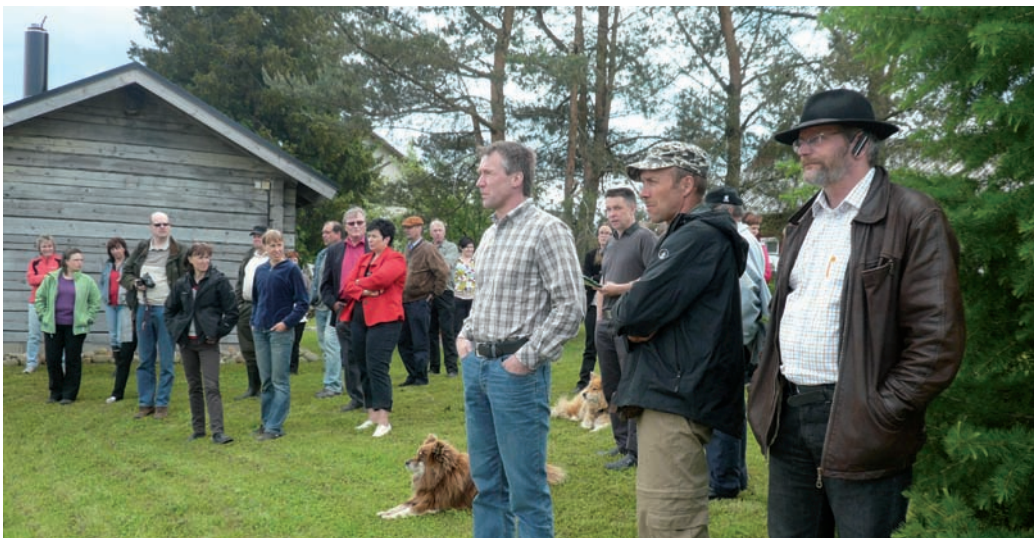
26 tilaisuutta käsittänyt ympäristökierue rantautui Alavudelle kesäkuun alussa. Tilaisuudessa paneuduttiin kosteikkojen perustamiseen, kunnostamiseen ja hoidon kehittämiseen.

Maaseutuverkostoyksikkö oli perinteisesti yhteistyökumppanina mukana myös maatalouden luonnon monimuotoisuuden neuvottelupäivillä helmikuussa Helsingissä. Joulukuussa järjestettiin Ympäristötuet yhdistyksille -seminaari Pasilassa. Seminaari jatkuu alueellisilla tilaisuuksilla vielä vuoden 2011 aikana.