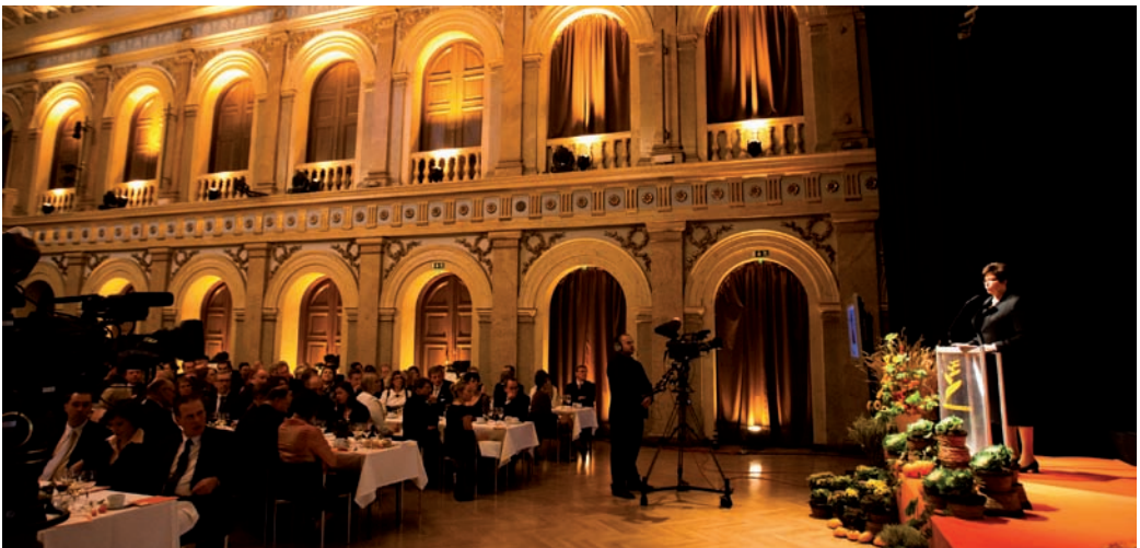
Parhaat käytännöt 2010 -kilpailu huipentui Vanhalla ylioppilastalolla, Helsingissä, järjestettyyn Maaseutugaalaan.

Teemavuoden Ympäristö 2010 -kiertueella paneuduttiin ympäri maata järjestetyissä 26 tilaisuudessa räätälöidysti alueiden omien ympäristökysymysten ratkaisemiseen. Kiertueen tilaisuuksiin osallistui kaikkiaan 852 ympäristöasioista kiinnostunutta ihmistä. Ympäristöteema oli esillä myös messuilla ja sidosryhmien järjestämissä tilaisuuksissa. Valtakunnallisissa seminaareissa Tampereella ja Helsingissä oli koolla kaikkiaan lähes 400 henkilöä kuulemassa viimeisiä tutkimustuloksia maatalouden ympäristötyöstä sekä keskustelemassa ja ideoimassa ympäristönhoidon tehostamista. Maaseutugaalassa jaettiin palkinnot Parhaat käytännöt -kilpailun voittajille, muun muassa parhaalle ympäristöpanostukselle.