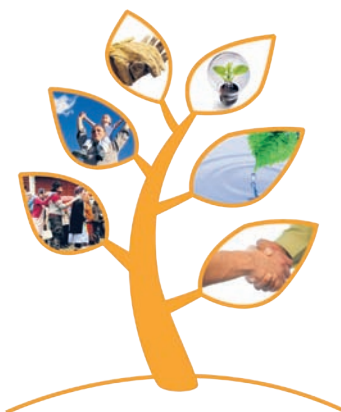
Parhaat käytännöt 2010

Suomen sisällä alueiden välistä yhteistyötä on edistetty valtakunnallisten ja alueellisten tapahtumien ja koulutusten kautta. Ne ovat koonneet yhteen eri alojen asiantuntijoita yli aluerajojen.