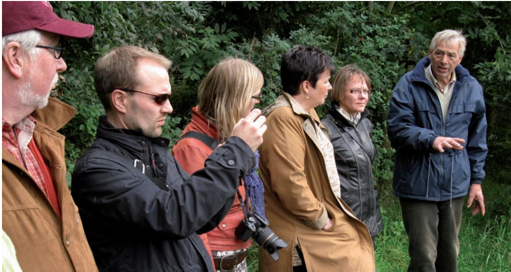
Hollannin opintomatkan aikana tutustuttiin maaseudun kehittämisohjelman toteuttamisen tilanteeseen, hallinnointiin ministeriötasolta toimijoihin saakka sekä esimerkkihankkeisiin.

Neljäs opintomatka oli ELY-keskusten ohjelmavastaavien matka Hollantiin lokakuussa. Matkan aikana tutustuttiin Hollannin maaseudun kehittämisohjelmaan kokonaisuudessaan ja sen toteuttamisen tilanteeseen, ohjelman hallinnointiin ministeriötasolta toimijoihin saakka sekä esimerkkihankkeisiin ohjelman toteuttamisesta. Matkalla oli mukana 17 osallistujaa.