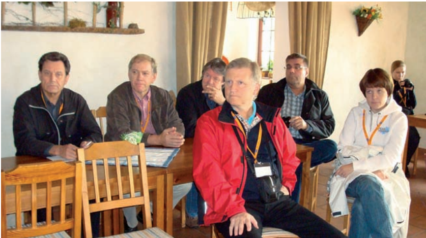
Rakentamisen asiantuntijoille ja suunnittelijoille suunnattu opintomatkka järjestettiin syyskuussa Saksaan Brandenburgin alueelle. Matkan teemana oli maaseuturakennusten uusiokäyttö.

Maaseutuverkoston rakentamisen asiantuntijoille ja suunnittelijoille suunnattu opintomatkka järjestettiin syyskuussa Saksaan Brandenburgin alueelle. Matkan teemana oli maaseuturakennusten uusiokäyttö. Matkalle osallistui 21 henkilöä.