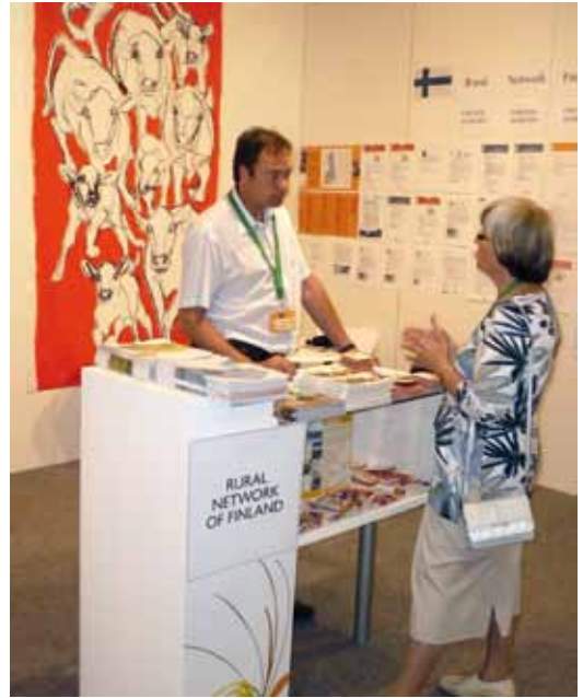
Maaseutuverkostoyksikkö osallistui maaseudunkehittämisseminaariin, FICODER (Foro Internacional de Cooperacion en Desarrollo Rural, Sevillassa Espanjassa 8.–10.6.2009.