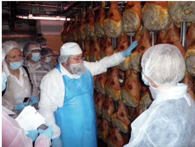
Rakennetukivastaavien ja sidosryhmien opintomatalla Italiassa tutustuttiin parmankinkun valmistukseen.

Leader-opintomatka Slovakiaan, Itävaltaan ja Unkariin 14.–18.9.2009