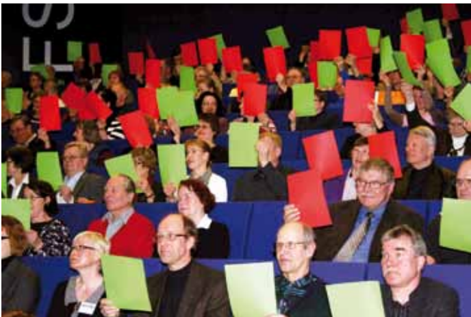
Alueelliset maaseututoimijat kokoontuivat Kymenlaakson maaseutufoorumiin 1.4.2009 Kotkaan.

Verkostoitumistavoitteet saavutettiin palautteen perusteella vuonna 2009 hyvin. Koulutustilaisuudet ja opintomatkat kokosivat sidosryhmätahoja laajasti eri teemojen ympärille. Myös kansainvälisille verkostoille ja yhteistyölle luotiin pohjaa opintomatkojen ja Leader-seminaarin kautta. Työryhmätyöskentelyyn osallistui laaja organisaatioiden edustajien joukko ja ryhmissä tuotettiin hyviä ideoita ja ehdotuksia maaseutuohjelman toteutuksen suunnitteluun. Opintomatkoilla lisättiin osallistujien keskinäisen kanssakäymisen mahdollisuutta yhteisin seminaarein ja vapaamuotoisen keskustelun kautta. Syksyn hankepäivät ja niihin liittyvät tutustumisretket mahdollistivat osallistujien verkostoitumista ja keskinäistä tiedonvaihtoa.