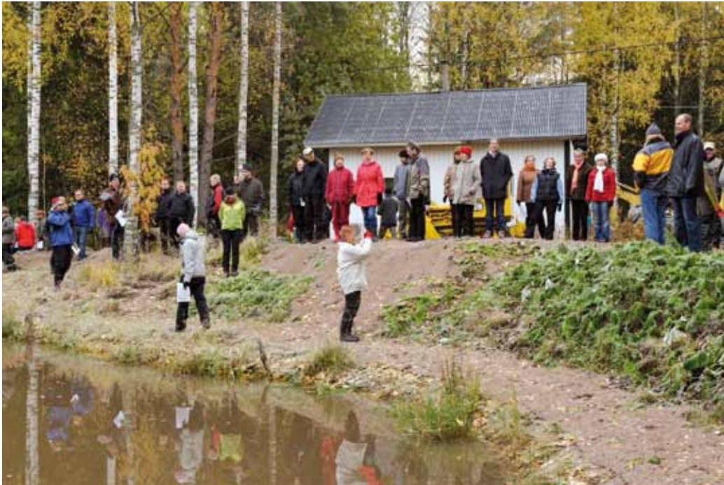
Ympäristöhankepäivillä tutustuttiin kosteikon rakentamiseen.