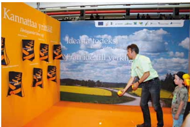
Farmari-maatalousnäyttelyssä Kokkolassa 30.7.–2.8.2009 kampanjoitiin maaseutuyrittäjyyden asialla.

Manner-Suomen maaseudun kehittämisohjelman viestintää yhteen sovittava ryhmä järjesti 20.1.2009 Helsingissä kehittämisohjelman viestintäyhdyshenkilöiden tapaamisen. Tapaamisen tarkoituksena oli tutustua uusiin ja vanhoihin viestinnän tekijöihin sekä jakaa kuulumisia puolin ja toisin. Päivän aikana käsiteltiin ohjelmaviestinnän ajankohtaisia asioita: erityisesti yrittäjyyskampanjaa ja Maaseutu.fi-kehittämisprojektia.