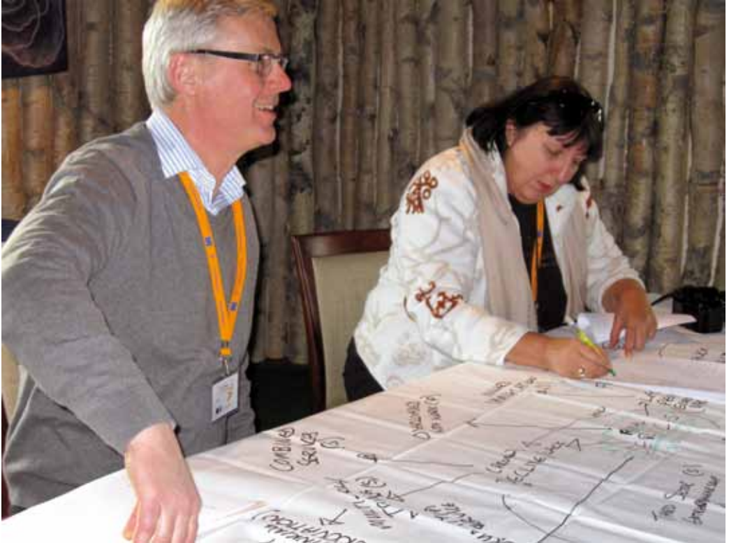
Maaseutuverkostoyksikön ja Lapin toimintaryhmien järjestämässä kansainvälisessä Levin Leader-seminaarissa, 17.–19.3.2009, pidettiin runsaasti erilaisia työpajoja.

Levin maaliskuisen kv-seminaarin tarpeisiin tuotettiin kolmikielinen Leader-taskuesite. Taskuesite sai suuren suosion suomalaisten ja ulkomaalaisten Leader-ryhmien keskuudessa, joten siitä otettiin lisäpainos jo loppukeväästä. Yhteistyössä ProAgrian kanssa tuotettiin Happamat sulfaattimaat -esite (suomi ja ruotsi). Säättösalaajitus-esite (suomi ja ruotsi) puolestaan tuotettiin yhdessä Salaojayhdistyksen sekä Pohjanmaan ruotsinkielisen tuottajajärjestön (Österbottens svenska producentförbundet) kanssa.